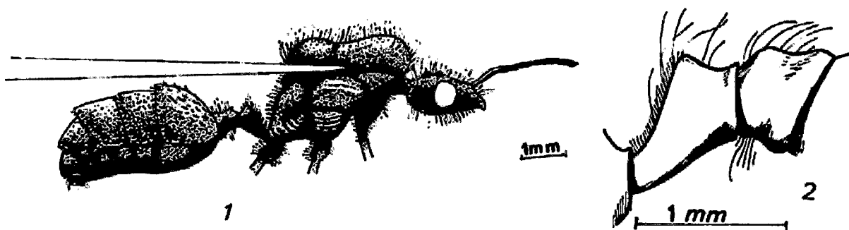
Figura 1: Vista lateral del macho de M. hispanicus Santschi. Figura 2: Perfil del peciolo y pospeciolo.

Long: 7,6-8,8 mm., color negro, fonículo y tarsos más claros, mate, rugoso con el abdomen más brillante. Pilosidad abundante de color amarillento pálido, de longitud variable (en general muy largo). Mandíbulas de seis dientes puntiagudos, apical de mayor tamaño, el resto muy variable; presentan una ligera tonalidad rojiza, tienen una escultura estriada longitudinal, con algunas cerdas largas sobre ambas caras. Palpos maxilares de cinco artejos; labiales de tres. Clípeo algo abombado con bastantes cerdas largas dirigidas hacia adelante y curvadas hacia la base, parte posterior algo más brillante. Area frontal brillante y poco arrugada, sin pubescencia. Ojos grandes, muy salientes, situados algo anteroventralmente, de color negro. Ocelos medianos, situados sobre pequeñas protuberancias, la distancia entre el anterior y uno de los posteriores es aproximadamente igual a dos veces su diámetro. Cabeza con los ángulos occipitales redondeados y el borde posterior ligeramente cóncavo. Resto de la cabeza mate y finamente reticulada. Gula con numerosas cerdas largas, formando un psamóforo bien patente.