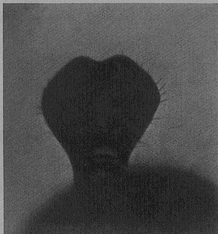
Schuppe einer Arbeiterin der Formica rufa pratensis incisa m. v. n. (32 fache Vergrößerung.) (Siehe S. 155.)

Aus Dr. Kraucher's Entomologischen Jahrbuch 1922