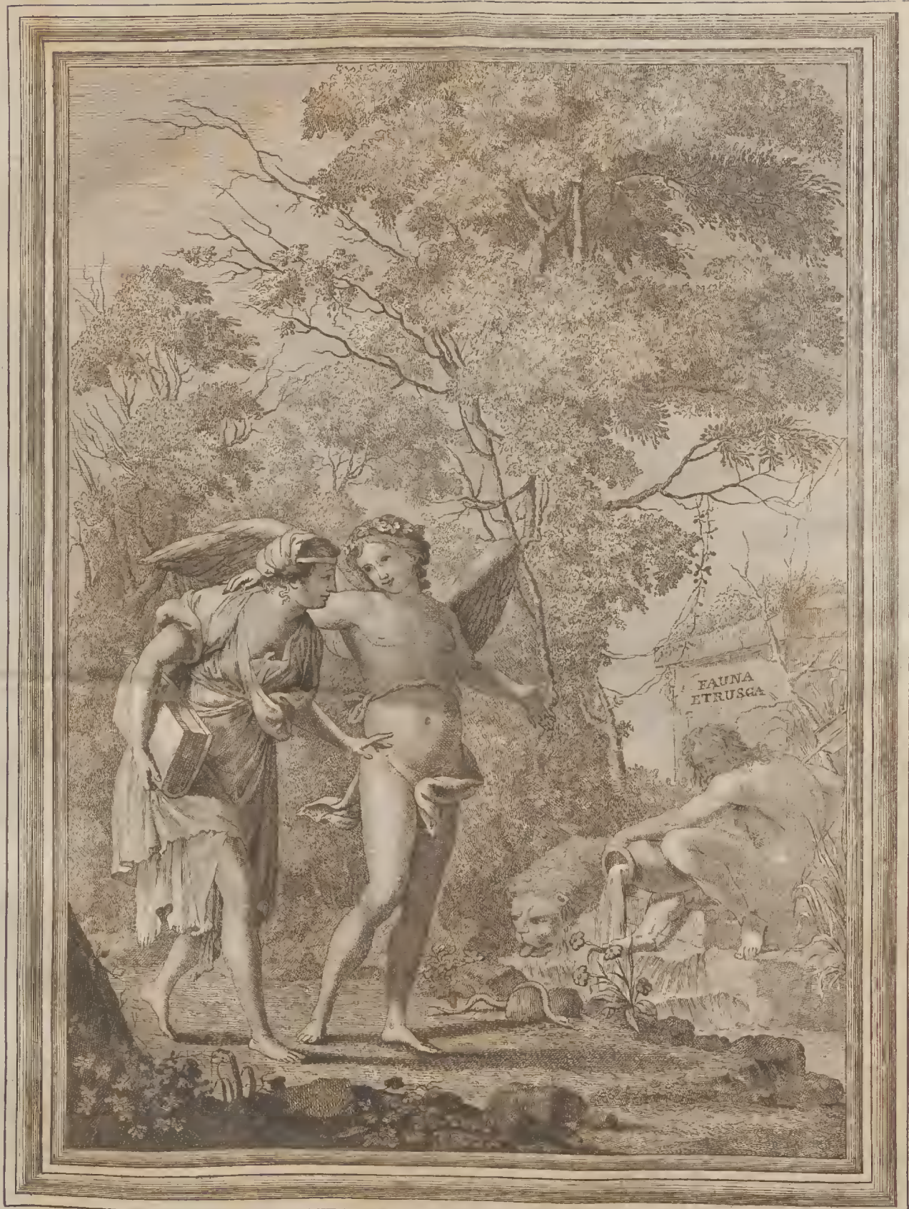
Xav. Salvioni inv. et del.