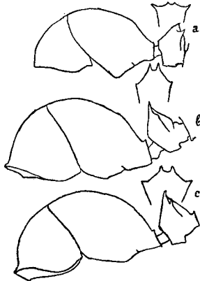
Fig. 2. Polyrhachis (Cyrtomyrma) rastellata LATR. ♂. a. var. corporali n. v. b. var. congener n. v. c. var. pagana n. v. Profil du thorax, et de l'écaille, celle-ci vue aussi de face.

♂. Long: 6 mm. Entièrement noire sauf le milieu des tibias